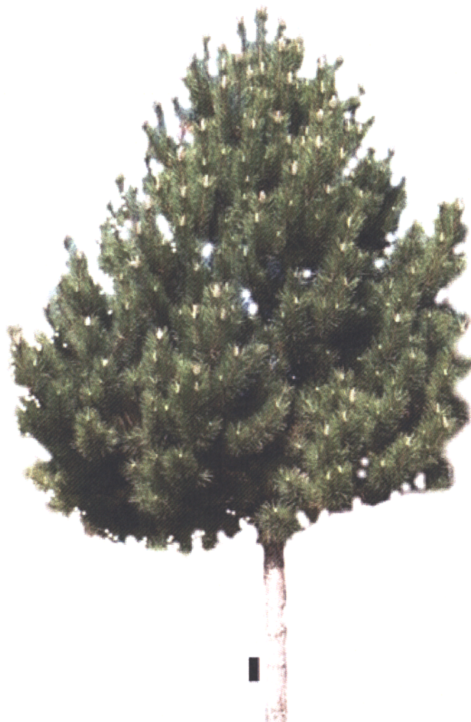
Sosna czarna ( Pinus nigra )